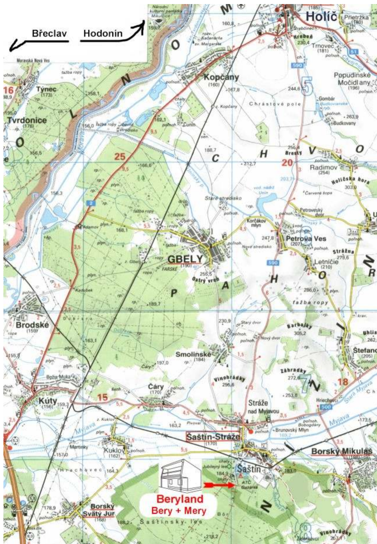
Mapa okolí a příjezdu do obce Šaštín-Stráže