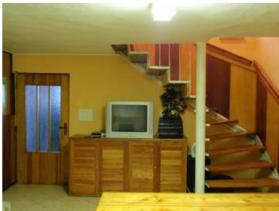
Hlavní místnost s krbem a velkým jídelním stolem v přízemí chaty BERY