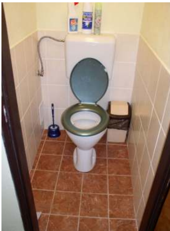
Sociální zařízení v chatě BERY