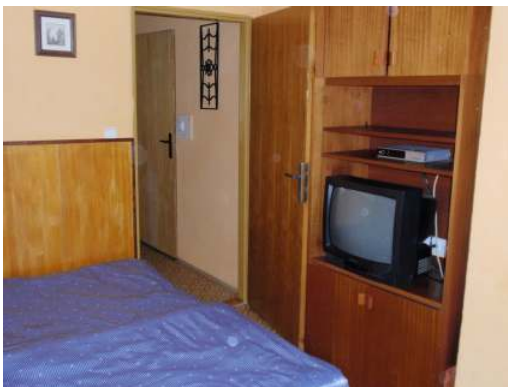
Druhá ložnice v patře chaty BERY , 3 lůžka