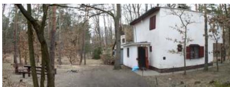
Panoramatický pohled na chatu BERY od silnice