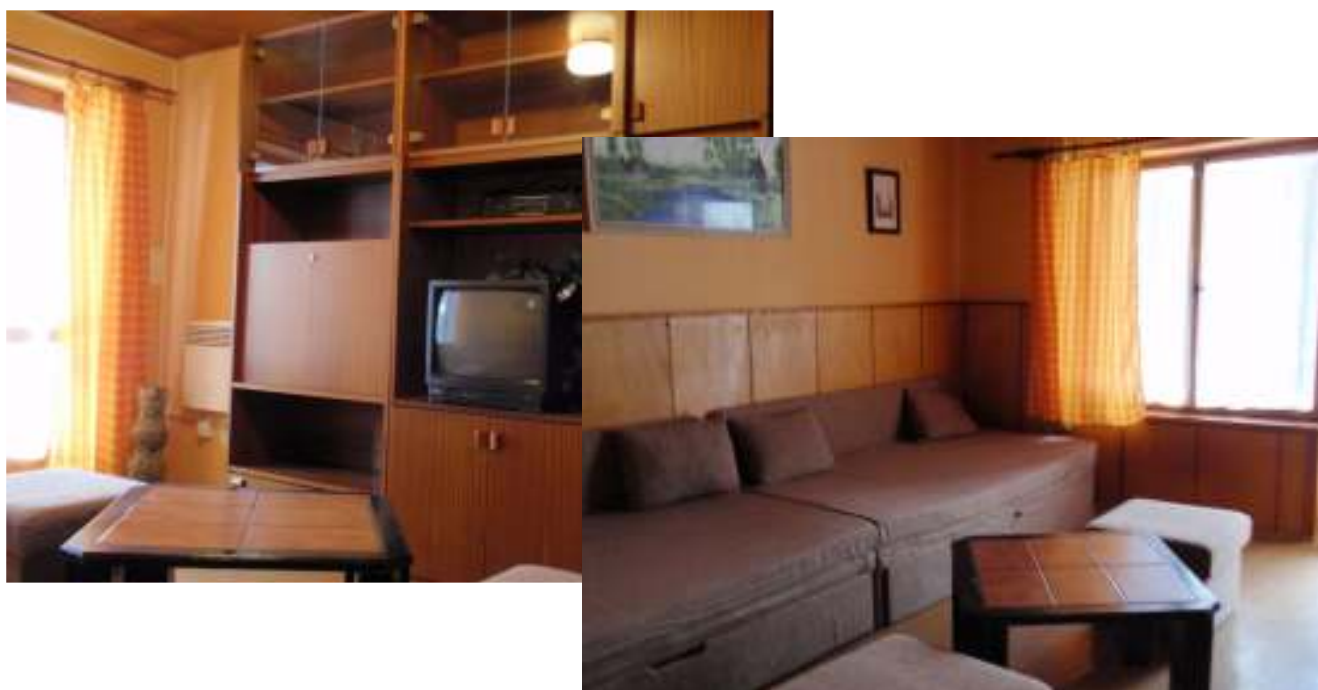
První ložnice v patře chaty BERY , 4 lůžka