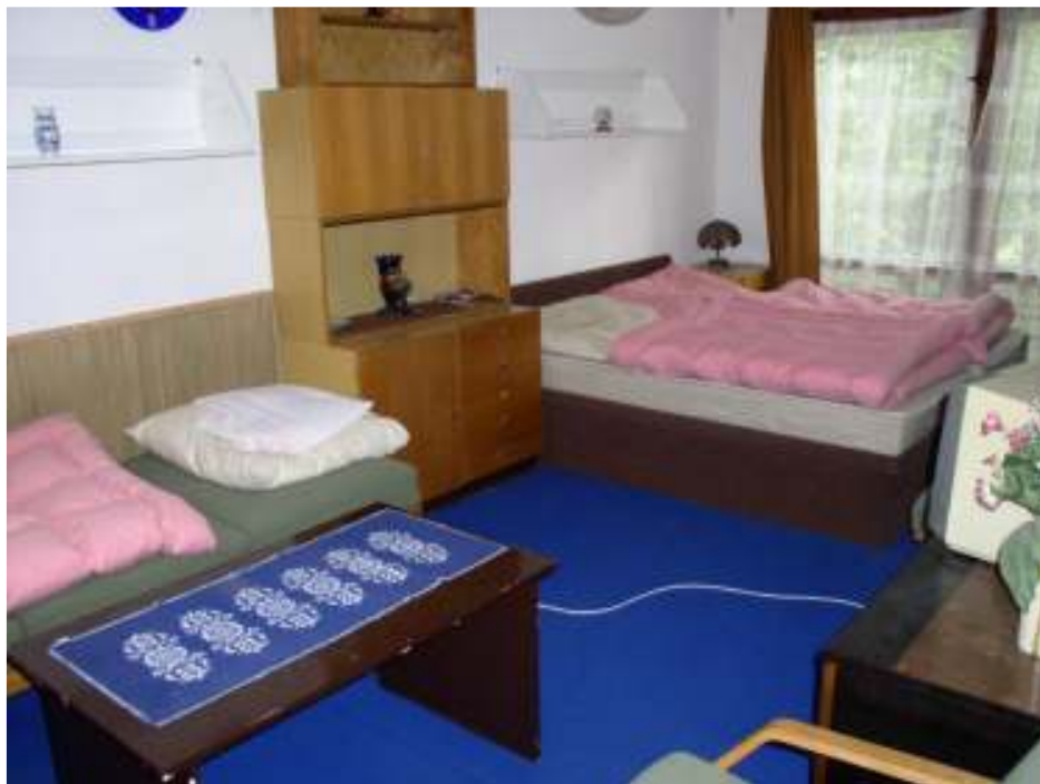
Druhá ložnice v patře chaty MERY , 4 lůžka