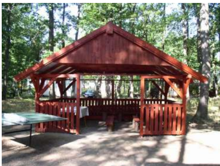
Za chatou je prostorný altán