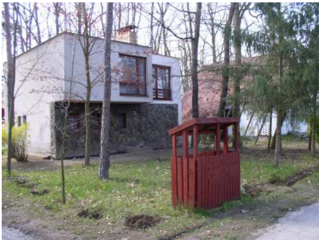
Čelní pohled na chatu MERY