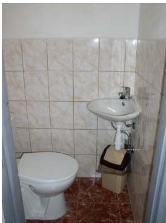
Koupelna s WC a samostatné WC chaty MERY