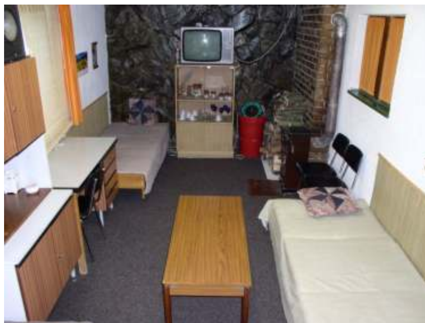
Pokoj v přízemí chaty MERY