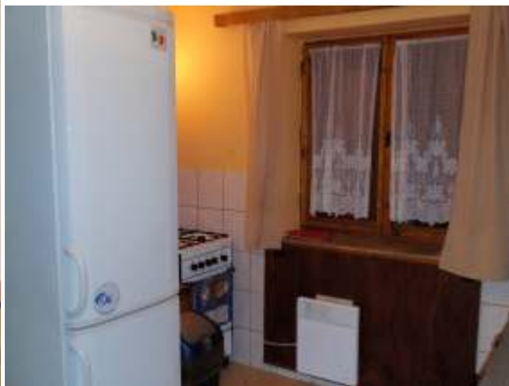
Kuchyně v chatě BERY