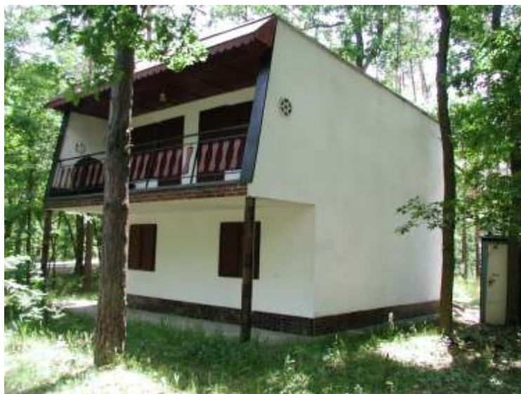
Čelní pohled na chatu BERY