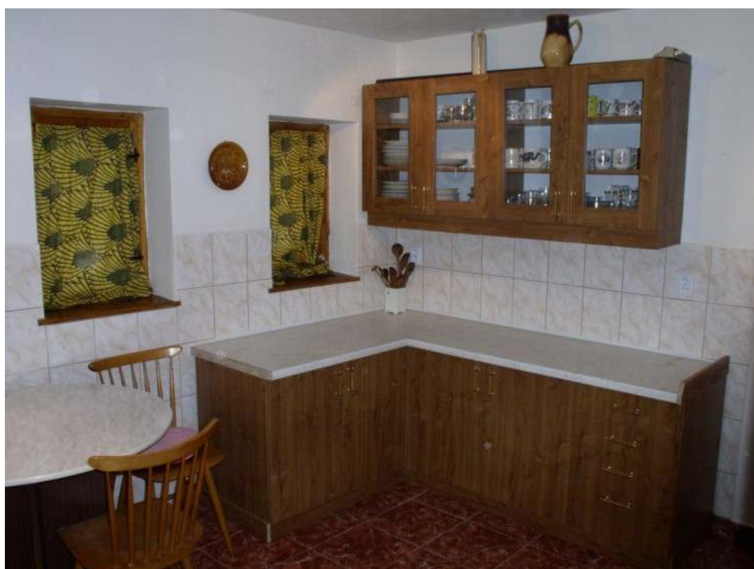
Kuchyně a jídelna chaty MERY