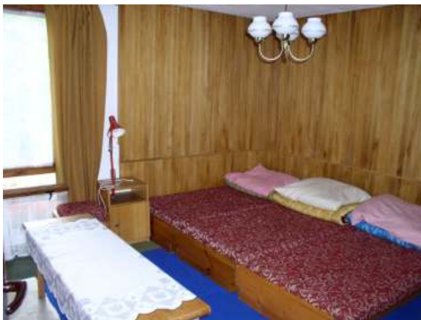
První ložnice v patře chaty MERY , 5 lůžek