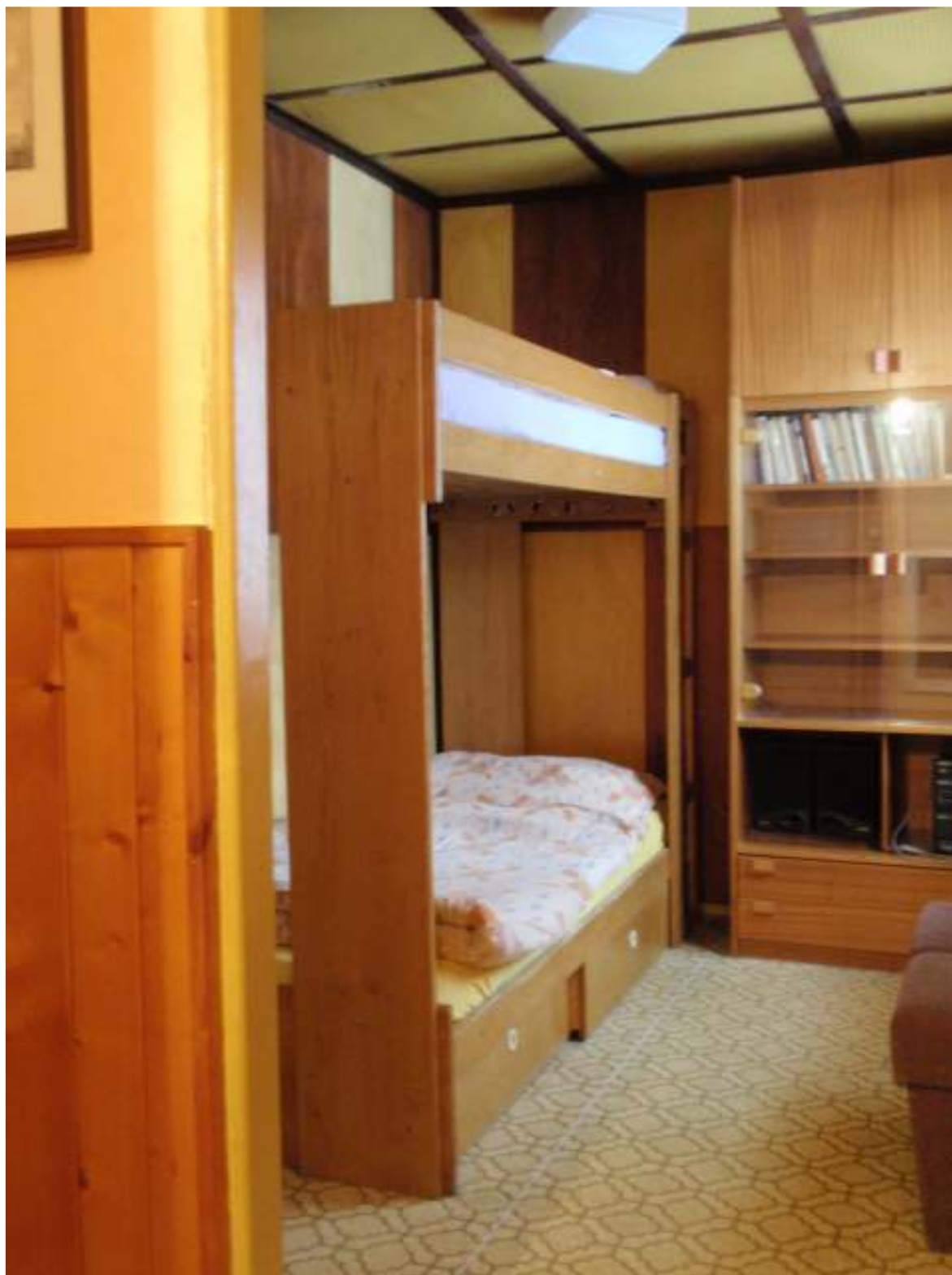
Třetí ložnice v patře chaty BERY , 2 lůžka v patrové úpravě , ložnice je průchozí ; prochází se přes ni do ložnice 2